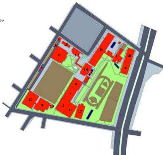
USO E OCUPAÇÃO DO ESPAÇO FÍSICO CAMPUS EDUCA