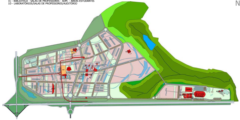
IMPLANTAÇÃO CAMPUS GLÓRIA