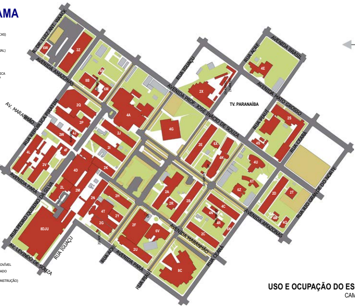
USO E OCUPAÇÃO DO ESPAÇO FÍSICO CAMPUS UMUARAMA