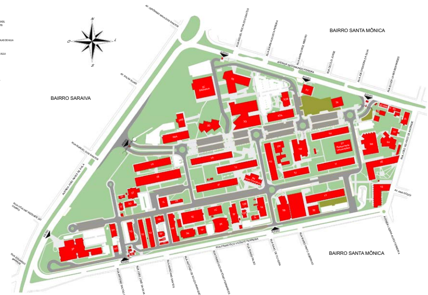
USO E OCUPAÇÃO DO ESPAÇO FÍSICO CAMPUS SANTA MÔNICA