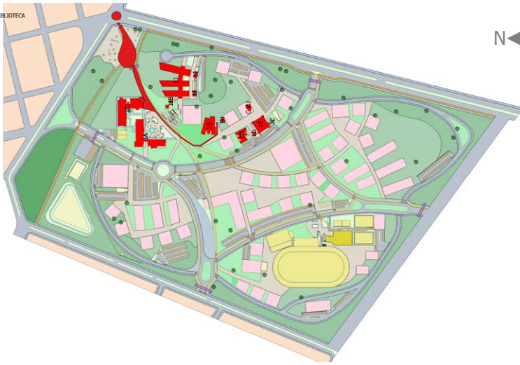
IMPLANTAÇÃO CAMPUS PONTAL