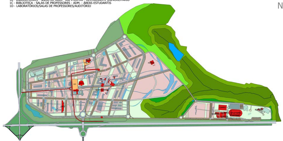
IMPLANTAÇÃO CAMPUS GLÓRIA