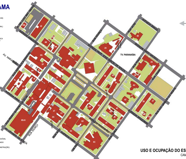
USO E OCUPAÇÃO DO ESPAÇO FÍSICO CAMPUS UMUARAMA