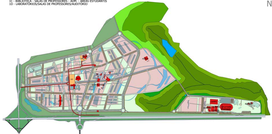
IMPLANTAÇÃO CAMPUS GLÓRIA