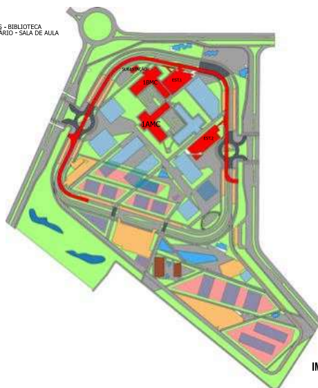
IMPLANTAÇÃO CAMPUS MONTE CARMELO

1AMC - ADM/SALA DE AULA - SALA DE PROFESSORES - BIBLIOTECA 1BMC - LABORATÓRIOS - RESTAURANTE UNIVERSITÁRIO - SALA DE AULA